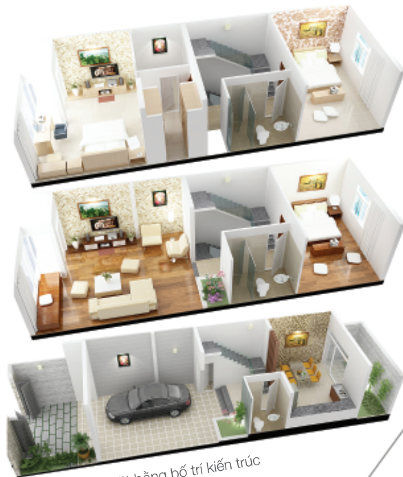
Mặt bằng bố trí kiến trúc