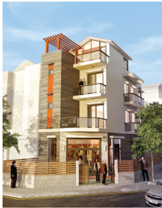
Phối cảnh mặt tiền

Khu căn hộ cao cấp Camelia (Hoa Trà) cao 14 tầng, được xây dựng trên phần diện tích hơn 12.000m 2 .