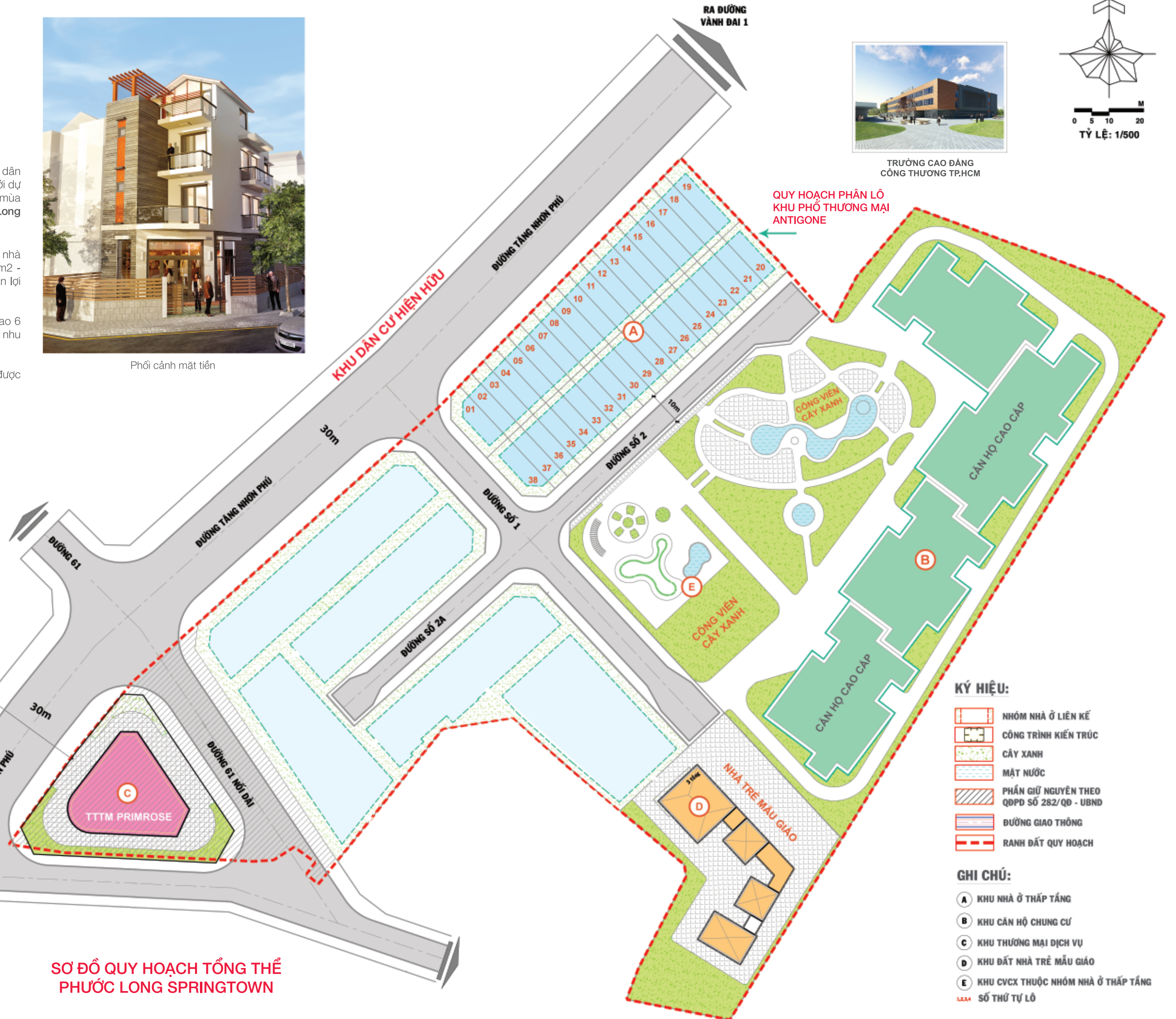
SƠ ĐỒ QUY HOẠCH TỔNG THỂ PHƯỚC LONG SPRINGTOWN