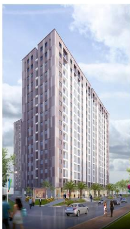
DỰ ÁN: CHUNG CƯ PHÚC THỊNH ĐỨC

Tiến độ: Đã có giấy chứng nhận quyền sử dụng đất, Quyết định chấp thuận đầu tư dự án, triển khai thiết kế cơ sở.